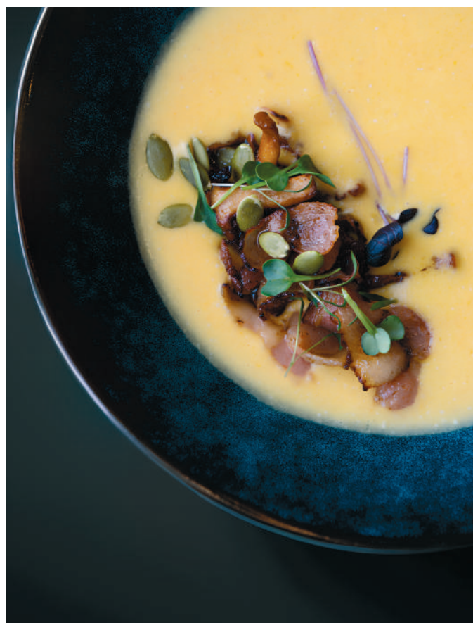
ТЫКВЕННЫЙ КРЕМ-СУП С ЛИСИЧКАМИ И БЕКОНОМ Pumpkin cream soup with chanterelles and bacon