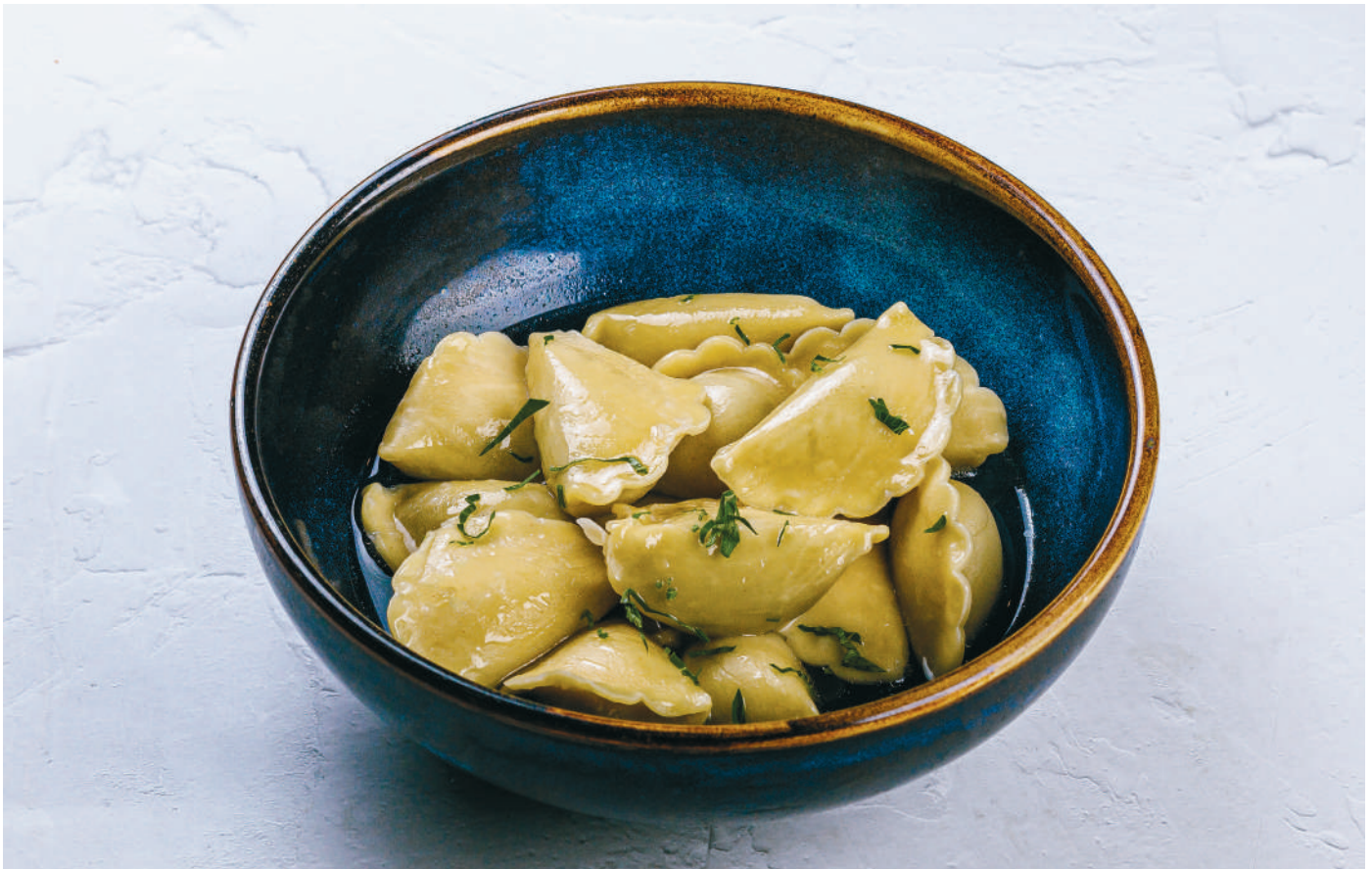
ВАРЕНИКИ С КАРТОФЕЛЕМ И ГРИБАМИ Vareniki (Russian dumplings with potatoes and mushrooms)