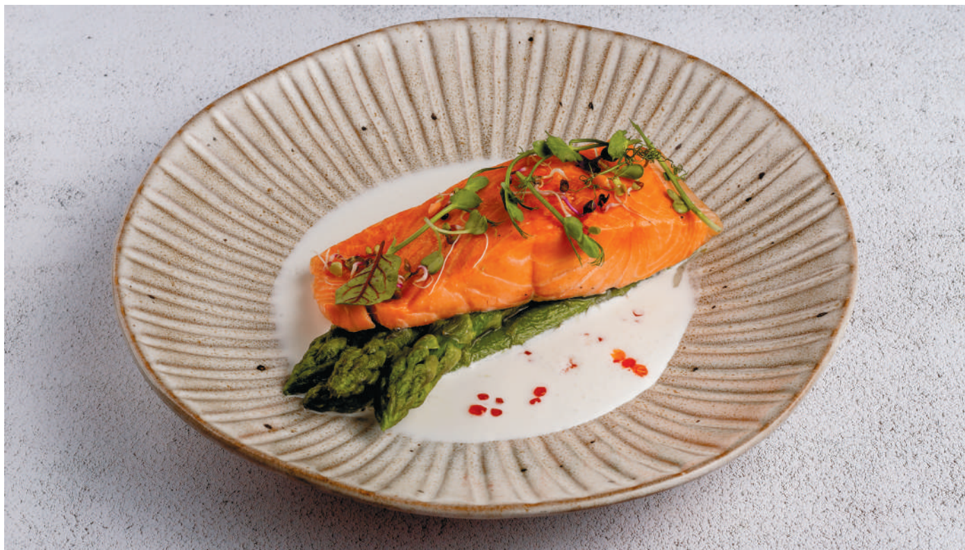
СТЕЙК ЛОСОСЯ СО СПАРЖЕЙ В СЛИВОЧНО-ИКОРНОМ СОУСЕ НА БЕЛОМ ВИНЕ Salmon steak with asparagus in creamy caviar sauce and white wine