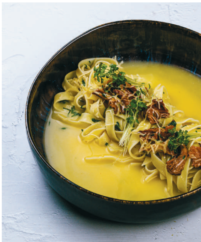
ПАСТА С ЛИСИЧКАМИ - 450 ₺ - Pasta with chanterelles