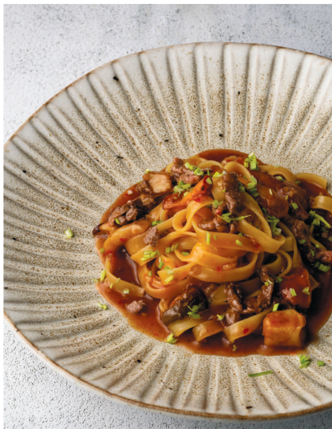
ПАСТА С РАГУ ИЗ ГРИБОВ, - 580 ₺ - ТОМАТОВ И ТЕЛЯЧЬИХ ХВОСТОВ Pasta with mushroom ragout, tomato and veal tails