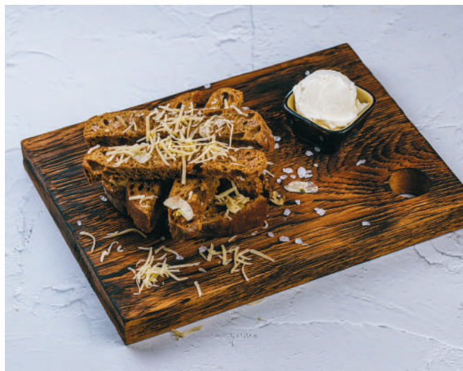
ГРЕНКИ С СЫРОМ И ЧЕСНОЧНЫМ СОУСОМ