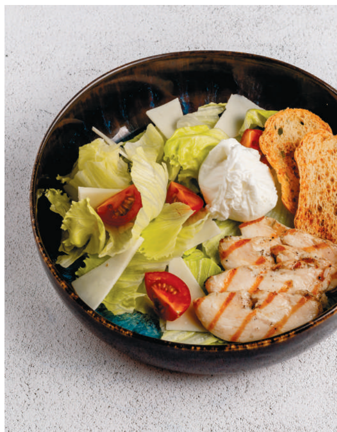
ЦЕЗАРЬ С КУРИНОЙ ГРУДКОЙ И ЯЙЦОМ ПАШОТ - 370 Р - Caesar salad with chicken breast and poached egg