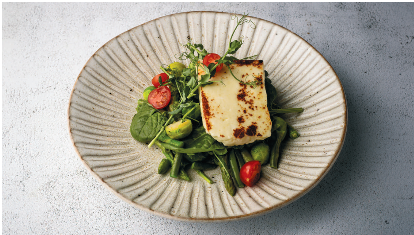
С ХАЛУМИ, СПАРЖЕЙ И ЗЕЛЁНОЙ ФАСОЛЬЮ With halloumi, asparagus and green beans