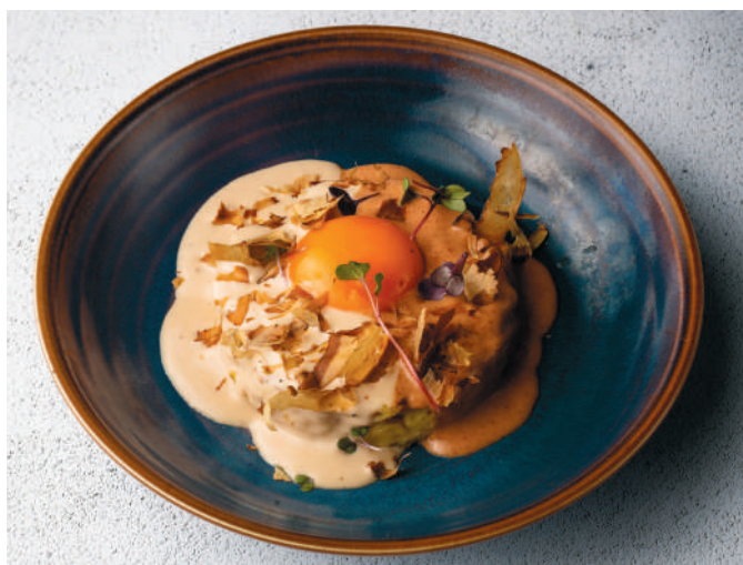
ДРАНИК ИЗ КАПУСТЫ С УГРЁМ Cabbage dranik with eel