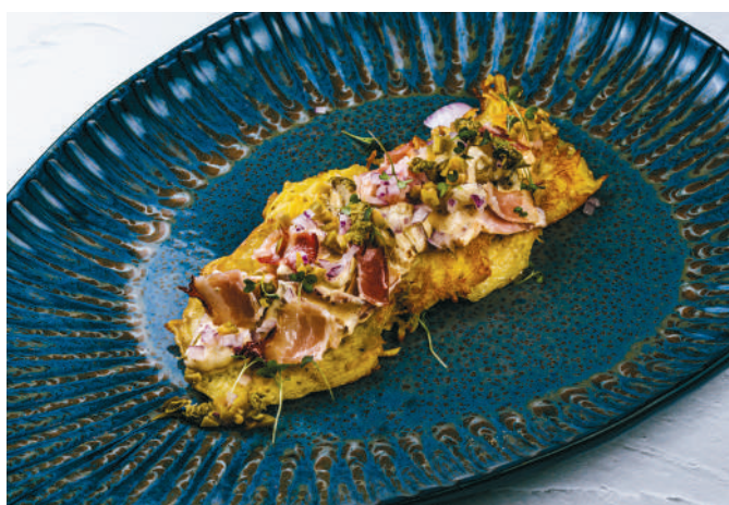
КАРТОФЕЛЬНЫЕ ДРАНИКИ С БЕКОНОМ И БЕЛЫМИ ГРИБАМИ Draniki with bacon and cep mushrooms