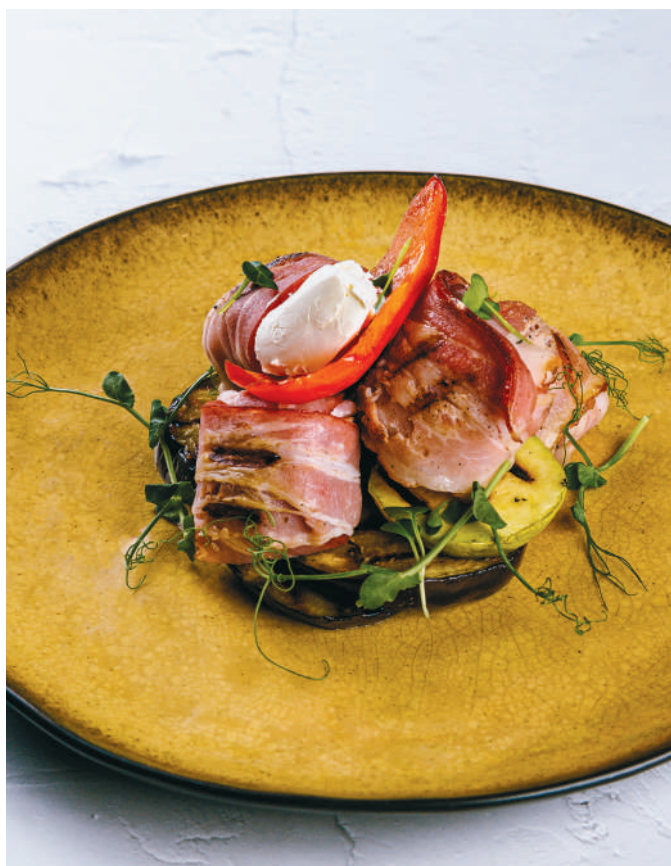
ИНДЕЙКА, ФАРШИРОВАННАЯ ЧЕРНОСЛИВОМ И СЫРОМ В БЕКОНЕ С ОВОЩАМИ ГРИЛЬ Turkey stuffed with prune and cheese in bacon with grilled vegetables