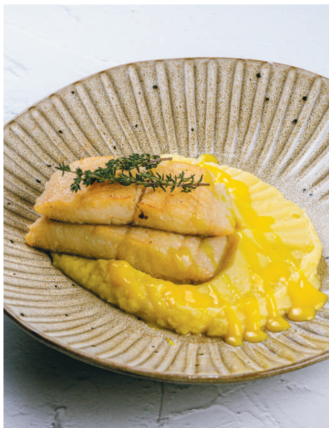
ФИЛЕ ПАЛТУСА В ГОЛЛАНДСКОМ СОУСЕ С КАРТОФЕЛЬНЫМ ПЮРЕ Halibut fillet in hollandaise sauce with mashed potatoes