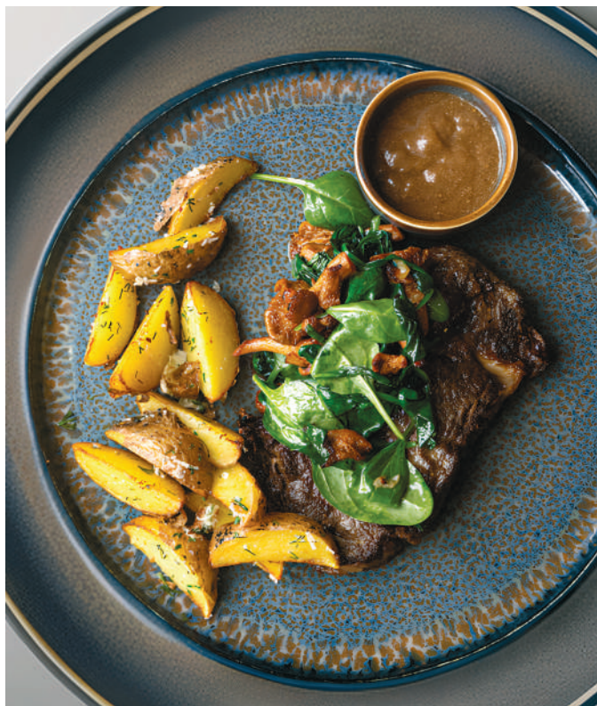
СТЕЙК РИБАЙ С ЛИСИЧКАМИ - 1480 Р - И КАРТОФЕЛЕМ АЙДАХО, ТРЮФЕЛЬНЫМ СОУСОМ «DEMI-GLAS» Ribeye steak with chanterelles and Idaho potatoes in "demi-glas" sauce