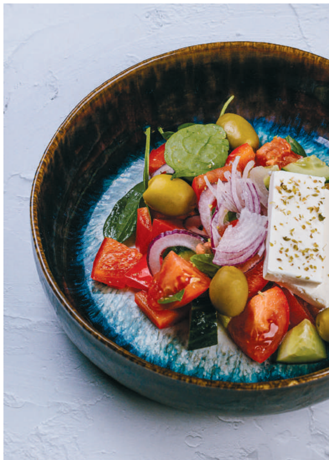
ГРЕЧЕСКИЙ САЛАТ Greek salad