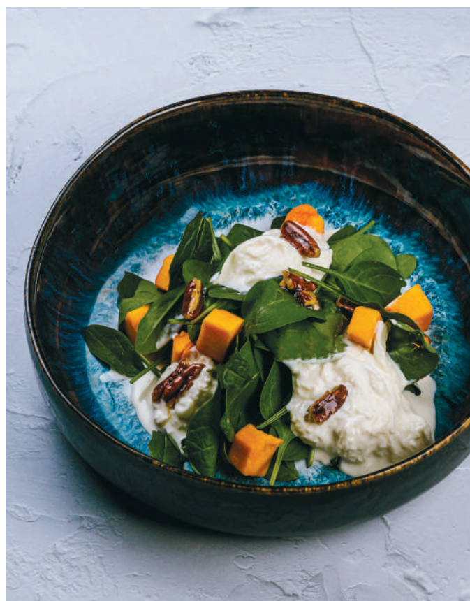
С СЫРОМ СТРАЧАТЕЛЛА, СПЕЛЫМ МАНГО И ОРЕХОМ ПЕКАН

With stracciatella cheese, mango and pecans