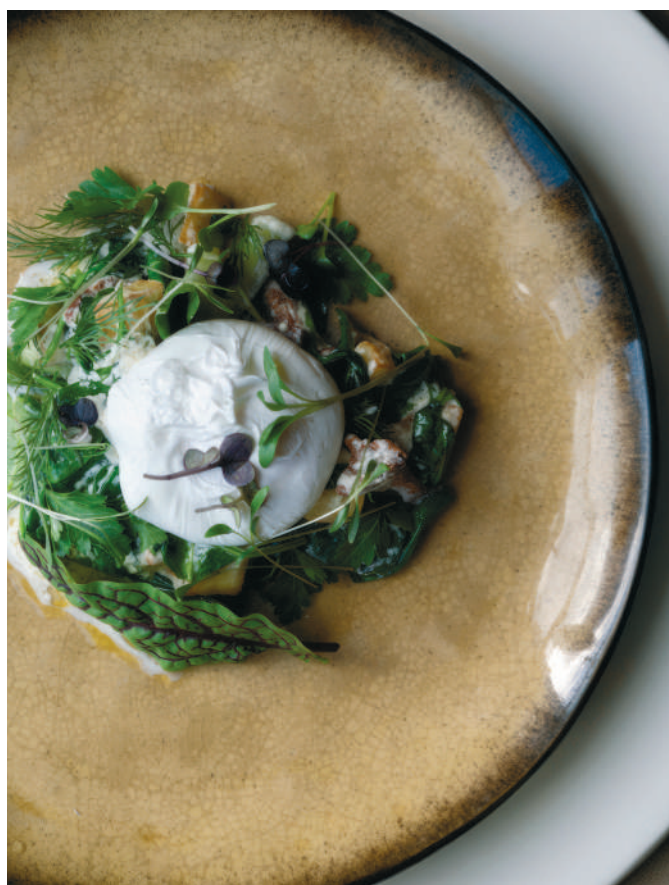
ТЁПЛЫЙ САЛАТ С ЛИСИЧКАМИ И ЯЙЦОМ ПАШОТ Warm salad with chanterelles and poached egg