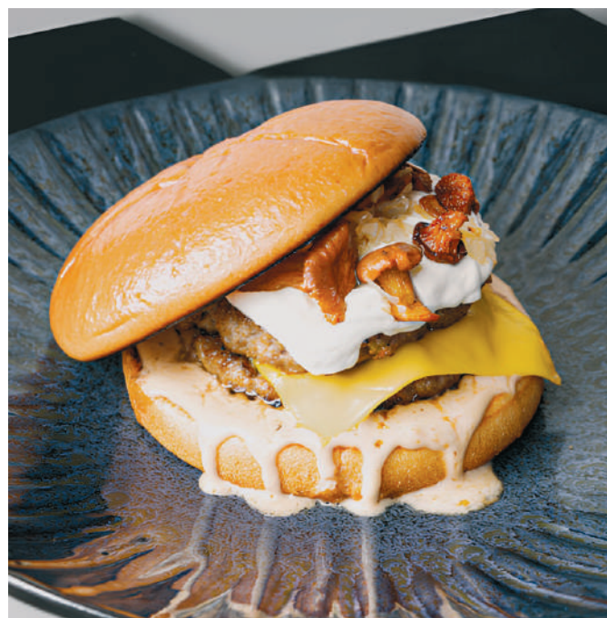
АВТОРСКИЙ БУРГЕР С ДВОЙНОЙ - 890 Р - КОТЛЕТОЙ ИЗ ГОВЯДИНЫ, НЕЖНЫМ СЛИВОЧНЫМ СЫРОМ И ЛИСИЧКАМИ В СОУСЕ ПРОСЕККО Author's burger with double beef patty, tender cream cheese and chanterelles in prosecco sauce