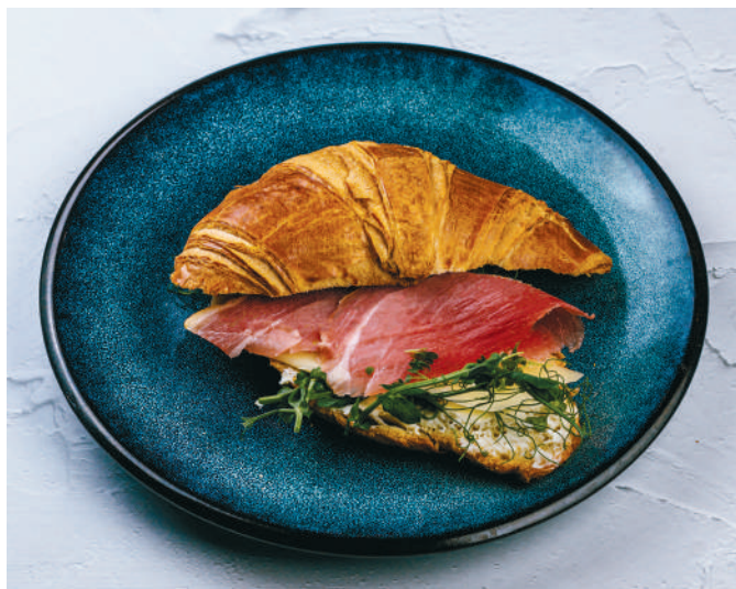
КРУАССАН С ПРОШУТТО Croissant with prosciutto