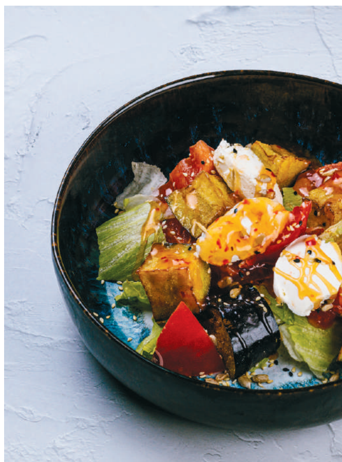
С ХРУСТЯЩИМИ БАКЛАЖАНАМИ With crispy eggplants