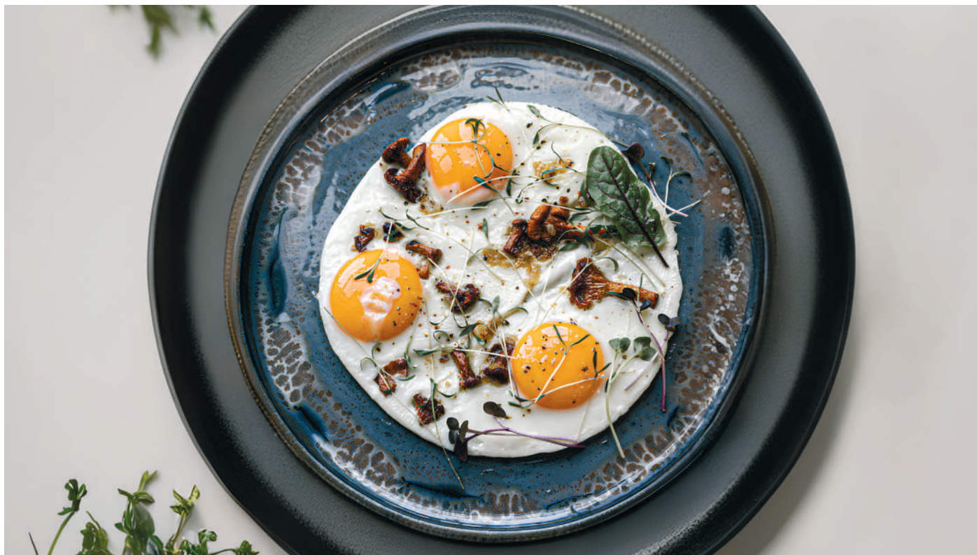
ЯИЧНИЦА С ЛИСИЧКАМИ И СЫРОМ СТРАЧАТЕЛЛА Fried eggs with chanterelles and stracciatella cheese