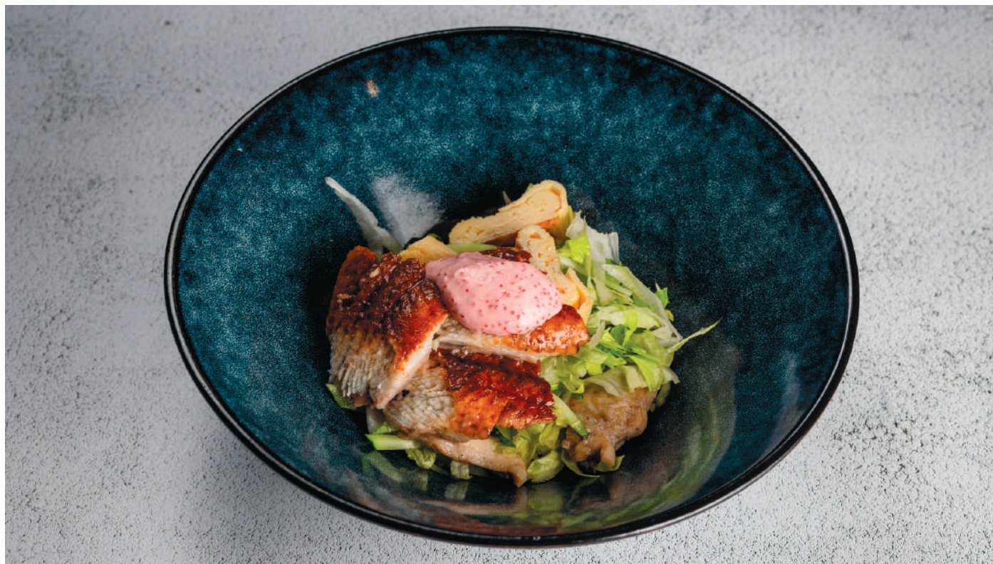
СЫТНЫЙ САЛАТ С КОПЧЁНЫМ УГРЕМ, ЖАРЕНОЙ КУРИЦЕЙ, ОМЛЕТОМ И СВЕЖИМ ОГУРЦОМ В ЯПОНСКОЙ ЗАПРАВКЕ Hearty salad with smoked eel, fried chicken, omelet and fresh cucumber in Japanese dressing