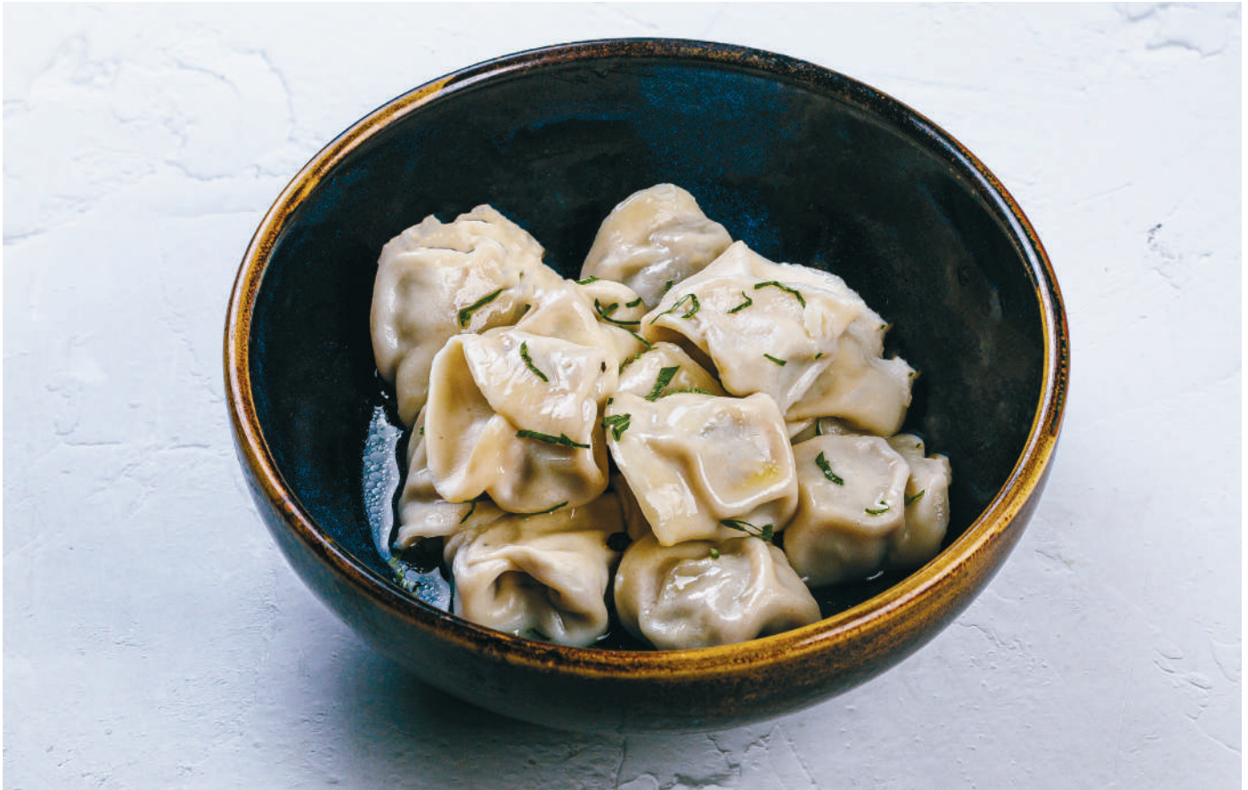
ПЕЛЬМЕНИ СИБИРСКИЕ Pelmeni (Russian dumplings with beef and pork)