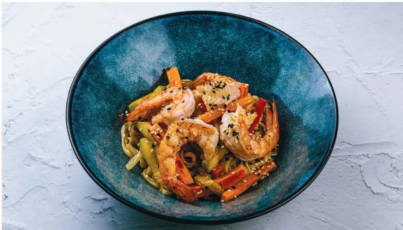
ПАНАЗИЯ С КРЕВЕТКАМИ - 470 ₺ - В УСТРИЧНОМ СОУСЕ Wheat noodles with shrimps in oyster sauce