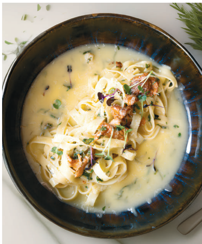
ПАСТА С ЛИСИЧКАМИ - 450 Р - Pasta with chanterelles