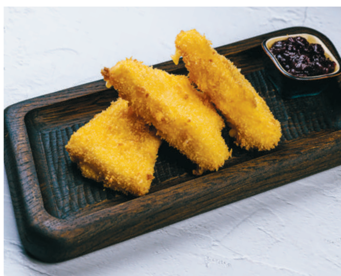
ЖАРЕННЫЙ СЫР С КЛЮКВЕННЫМ СОУСОМ Grilled cheese with cranberry sauce