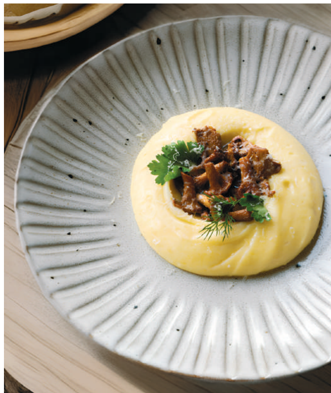
ТРЮФЕЛЬНОЕ ПЮРЕ - 490 Р - С ЛИСИЧКАМИ И СЫРОМ ПАРМЕЗАН Truffle puree with chanterelles and Parmesan cheese