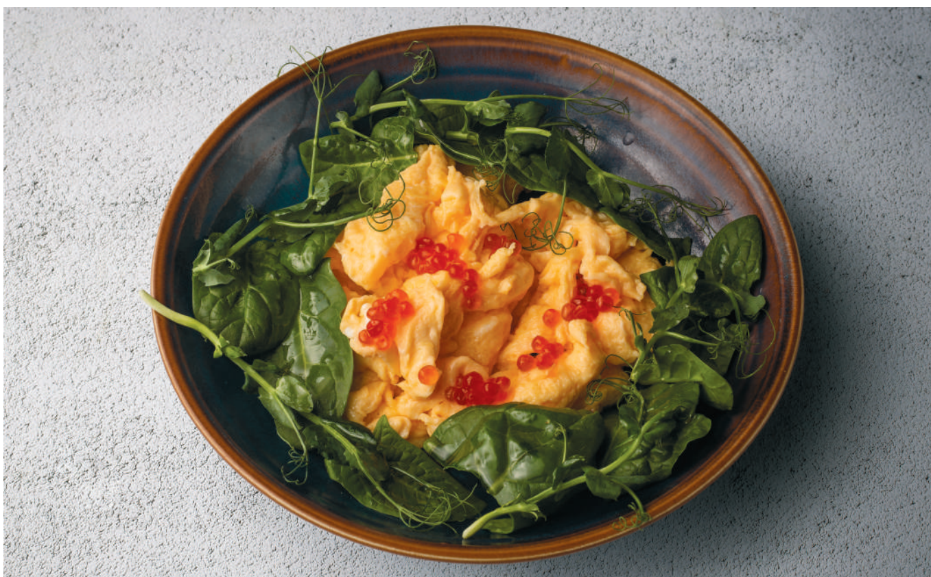
СКРЕМБЛ НА СЛИВОЧНОМ МАСЛЕ С КРАСНОЙ ИКРОЙ / SCRAMBLE WITH RED CAVIAR