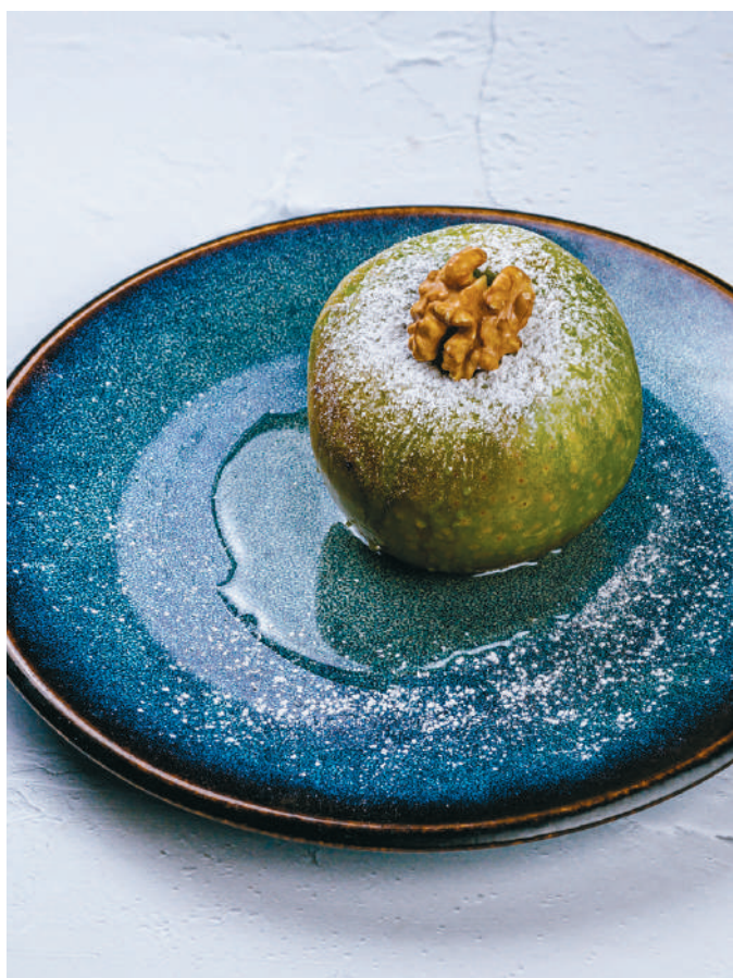
ПЕЧЁНОЕ ЯБЛОКО С МЁДОМ И ГРЕЦКИМ ОРЕХОМ Baked apple with honey and walnut