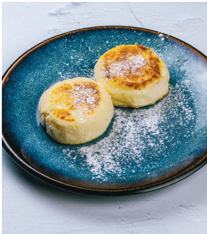
ДОМАШНИЕ СЫРНИКИ Homemade syrniki (Cottage cheese pancakes)