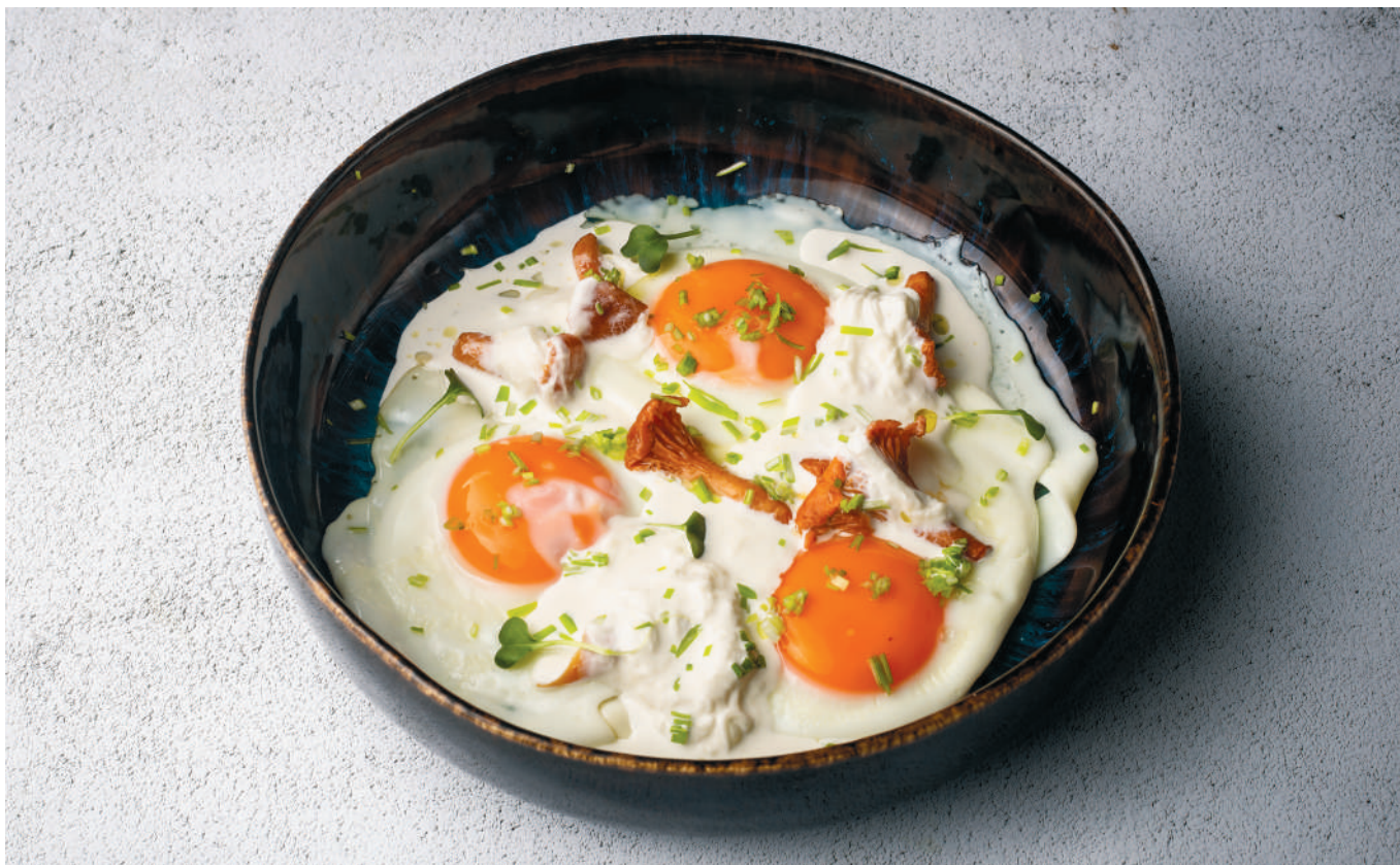
ЯИЧНИЦА С ЛИСИЧКАМИ И СЫРОМ СТРАЧАТЕЛЛА / FRIED EGGS WITH CHANTERELLES AND STRACCIATELLA CHEESE